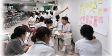
Ⅱ リーダー・メンバーの役割