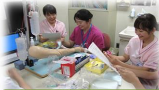
OJT 基本看護技術演習 採血

11項目の基本看護技術演習は、OJTで行っています。部署の先輩看護師からしっかり教わっていますね。